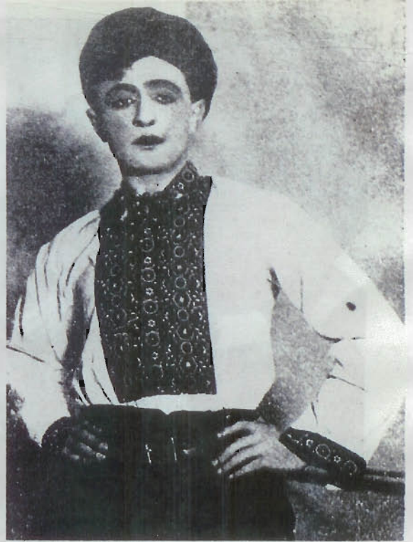
מ. ש. כאסין "יענקל בוילע" אין לעאן קאברניס "דער דארפס-יונג"