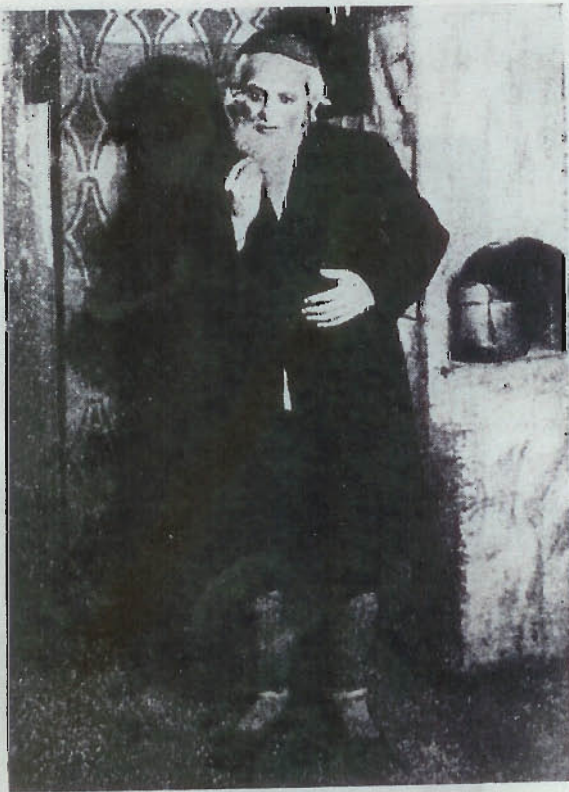
מ. ש. כאסין "לייוער בדכן" אין יעקב גארדיניס "גאט מענש און טיוול"