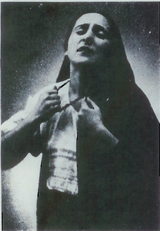
ו. קאצין „חווה“ אין שלום-עליכמ'ס „טביה דער מילכיקער“