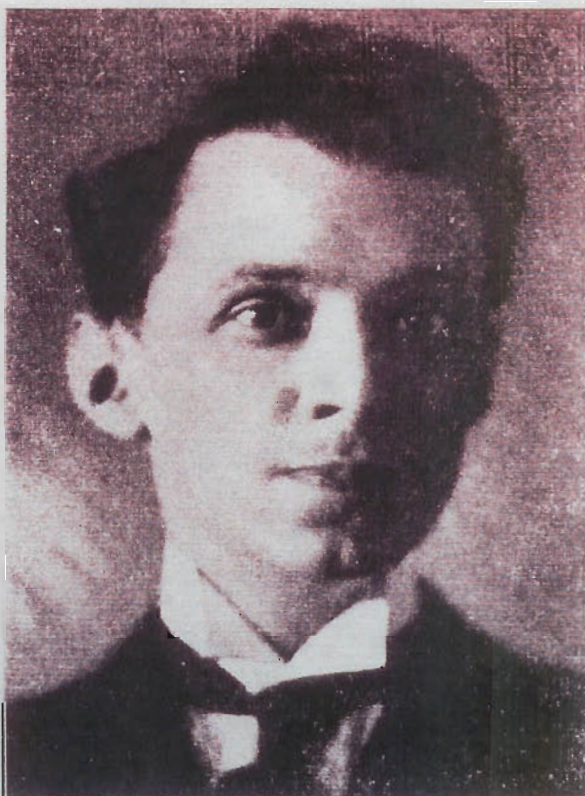
ד. ל. שומאקאו רעזשיסער פון 1920 ביז 1926.