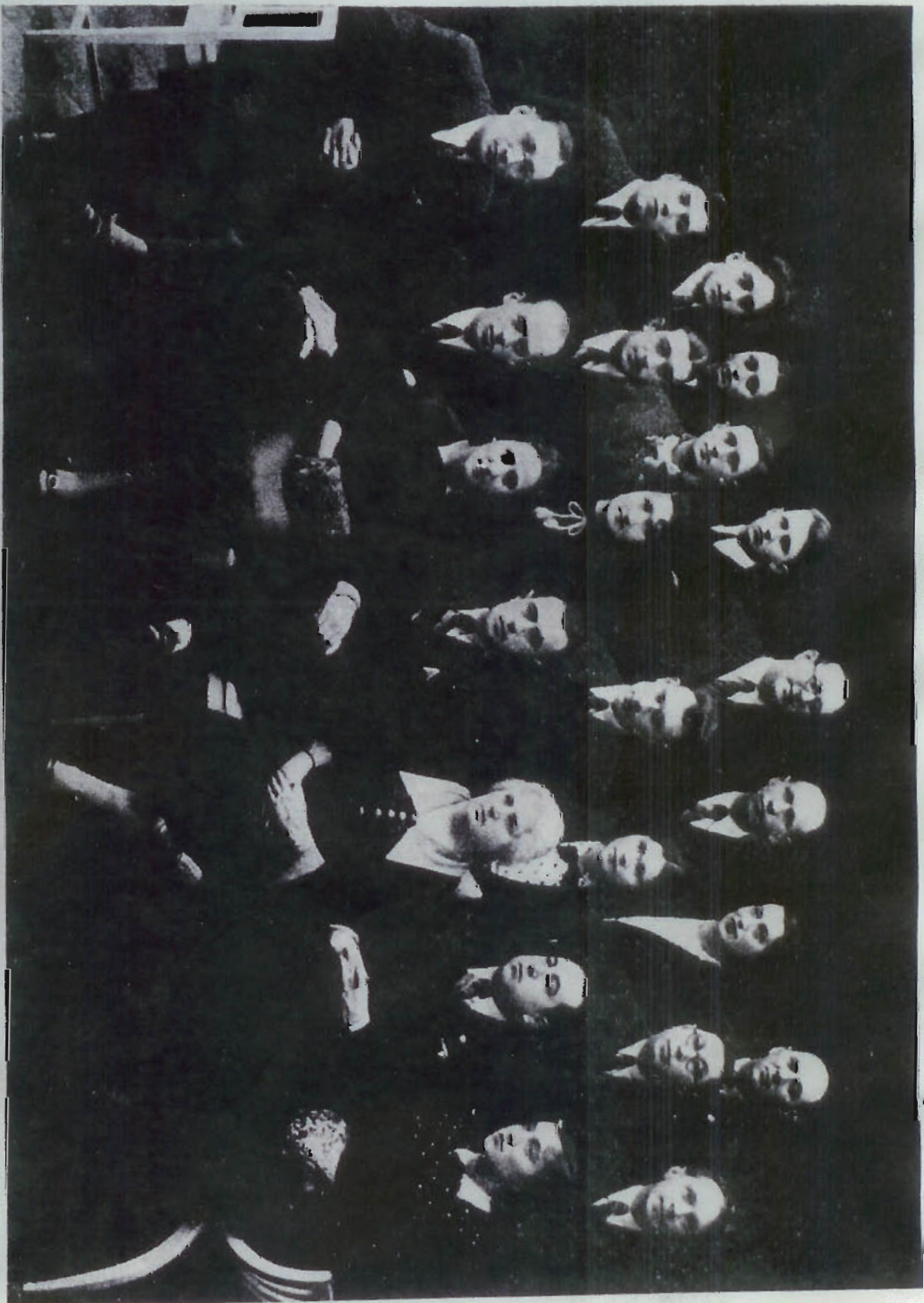
מיטגלידער פון סארטווער יידישן דראמאטישן קרייז פאר די יארן 1937—1917